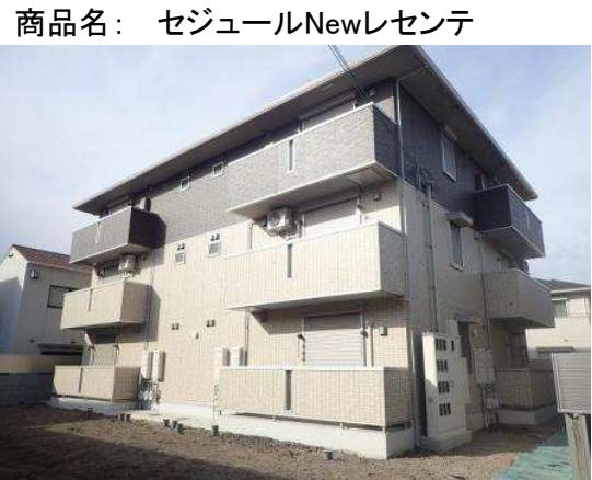
※パース写真の場合は、現況優先とします。

SECOM セコムセキュリティシステム搭載 ※鍵を一本、警備会社へお渡しいたします。