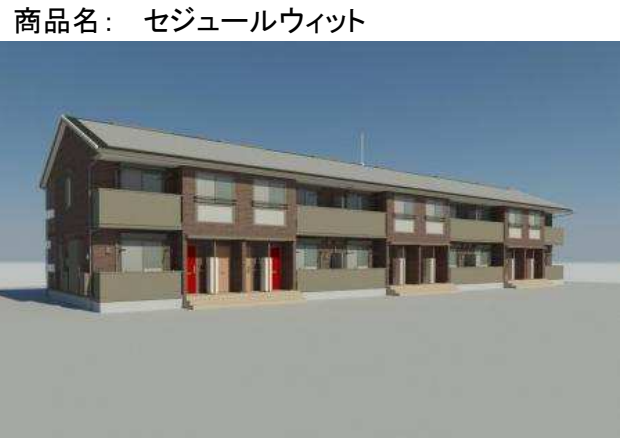
※パース写真の場合は、現況優先とします。