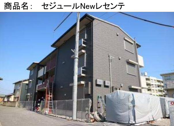
※パース写真の場合は、現況優先とします。

SECOM セコムセキュリティシステム搭載 ※鍵を一本、警備会社へお渡しいたします。