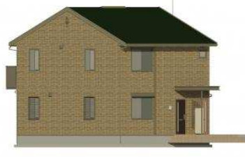
完成予想図につき、実際とは多少異なる場合がございます。